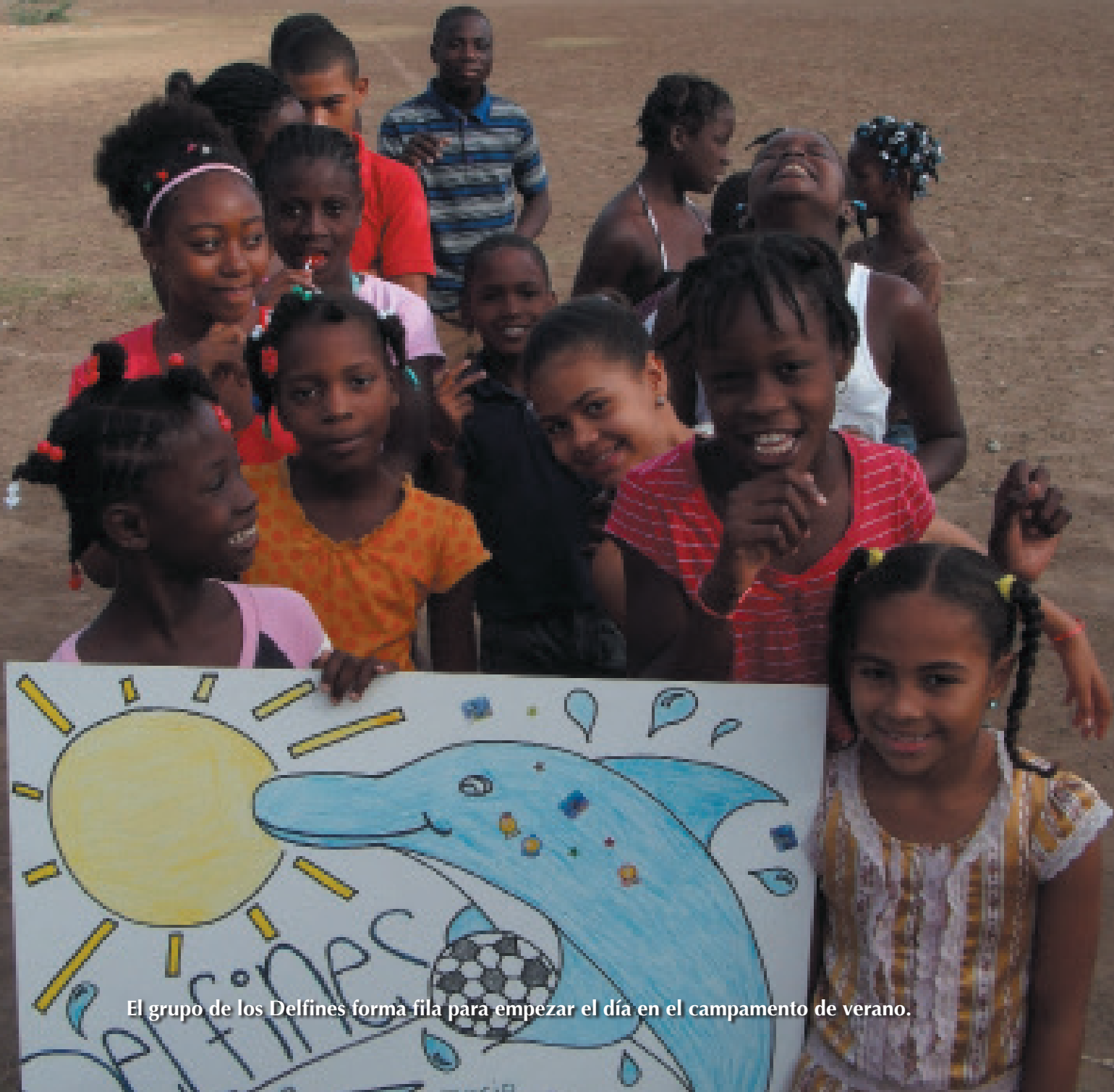
El grupo de los Delfines forma fila para empezar el día en el campamento de verano.

info@yspaniola.org facebook.com/yspaniola twitter.com/yspaniola