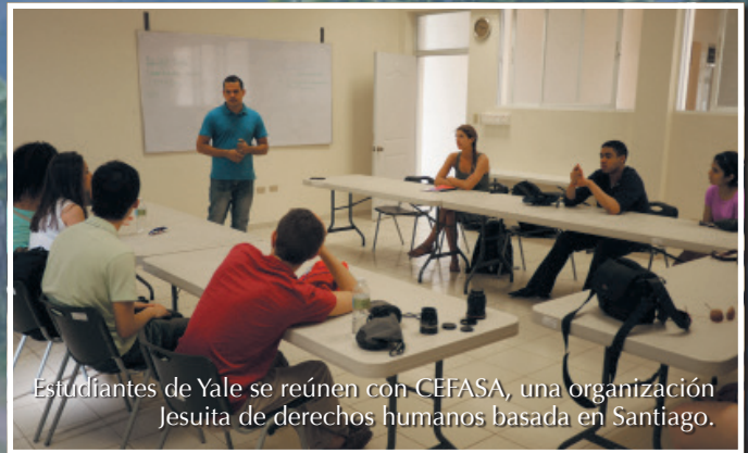
Estudiantes de Yale se reúnen con CEFASA, una organización Jesuita de derechos humanos basada en Santiago.

Estudiantes de la Universidad de Virginia hacen un recorrido por sembradíos de arroz fuera de Batey Libertad.